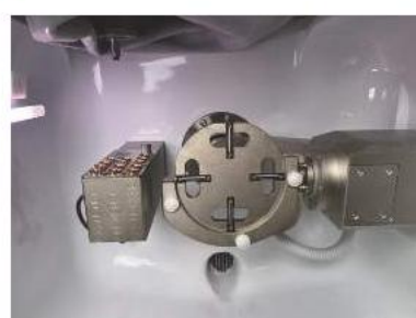
(A kalibráló tárcsa beszerelése)