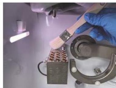
(A vágóblokk tisztítása)