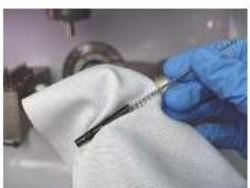
(A szorítóhüvely tisztítása)