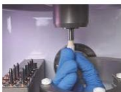
(Az orsó tisztítása)