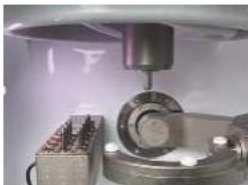
(Kattintson a kalibráláshoz)