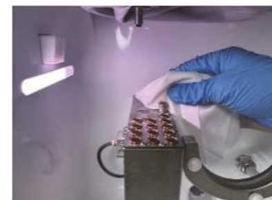
(A kalibrációs oszlop törlése)